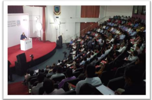
பொதுத் துறை ஊழியர்களின் வகிபாகத்தை மாற்றுதல், SLITHM