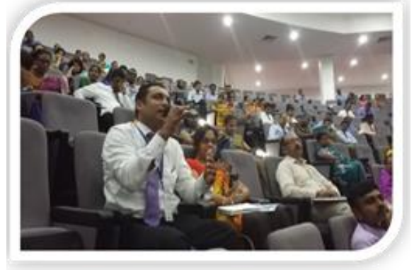
பொதுத் துறை ஊழியர்களின் வினைத்திறனை அதிகரித்தல், SLITHM